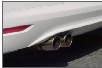
COX 2pcs Muffler