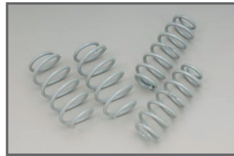
COX Spring Kit