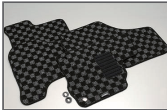
COX Floor Mat