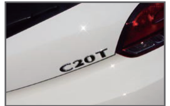
■Rear C20T Emblem