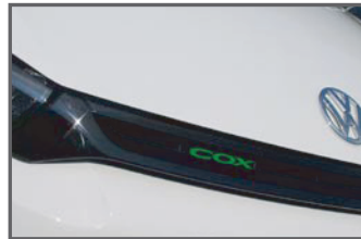
■Front COX Green Emblem