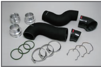
■COX H/D Turbo Pipe (4pcs)