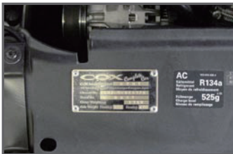
■Engine Room Plate